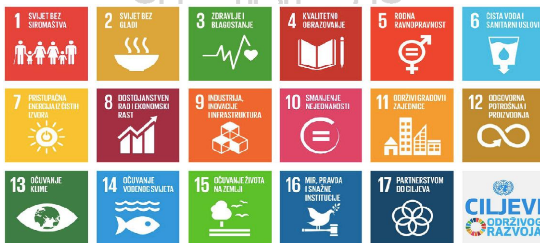
Slika 2. Globalni ciljevi održivog razvoja

Važnost održivog razvoja prepoznata je i na razini Ujedinjenih naroda koji su u siječnju 2015. godine donijeli 17 ciljeva održivog razvoja (predstavljaju nastavak na osam Milenijskih ciljeva razvoja kojima je cilj bio smanjenje ekstremnog siromaštva u razdoblju od 2000. do 2015. godine). Spomenuti ciljevi univerzalni su, primjenjivi u svim zemljama i međusobno su povezani, a za njihovo postizanje nužna je uska uključenost svih dionika. Zamišljeni su kao nacrt za postizanje bolje i održive budućnosti za sve i temeljeni na globalnim izazovima s kojima se suočavamo.